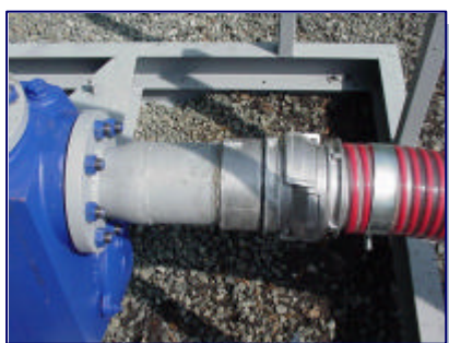
Raccordement des tuyaux