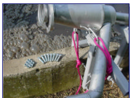
Fixation de l'hydroéjecteur