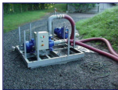
Fonctionnement de la pompe : continu ou contrôlé par timer